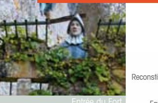
Entrée du Fort