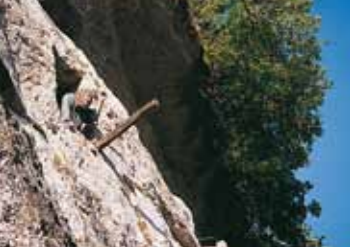
Poste de guet