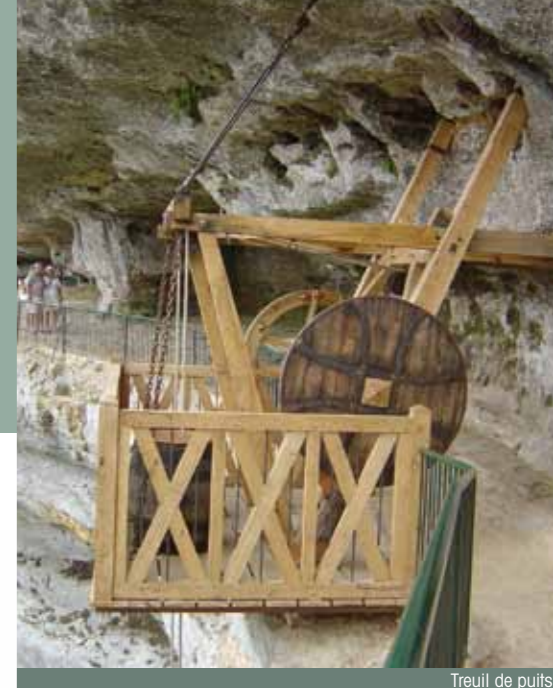
Treuil de puits

Depuis des millénaires, le peuple des falaises en avait fait son imprenable refuge