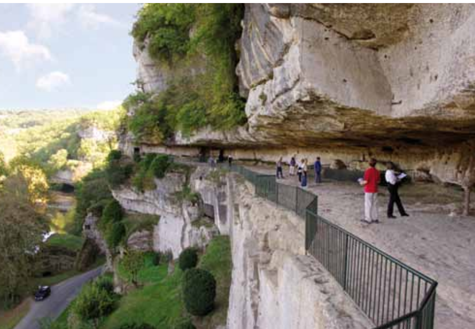
Le grand abri de 400 mètres mondialement connu sous le nom de «Boulevard de l'Humanité»

Remarquable par ses formes puissantes, son nombre d'habitats et son ancienneté d'occupation par l'homme, ce site constitue un cadre d'une rare et sauvage beauté.