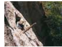
Salle de guetteur creusée dans la roche

Aux périodes historiques, les hommes n'ont pas abandonné les lieux, bien au contraire,