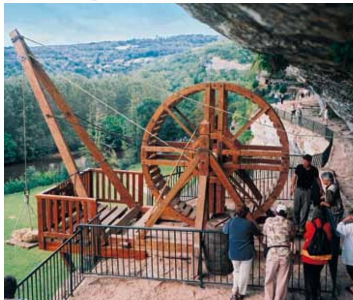
Réplique exacte en état de marche d'un treuil à tambour