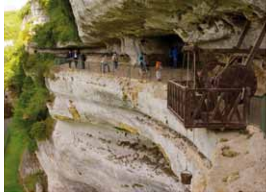
Le treuil de puits et la grande terrasse