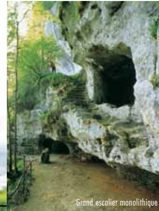
Grand escalier monolithique