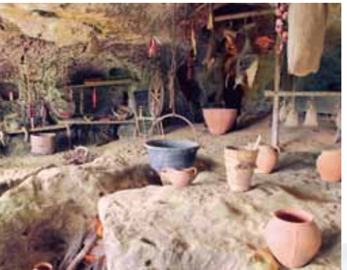
Cuisine de l'An Mil