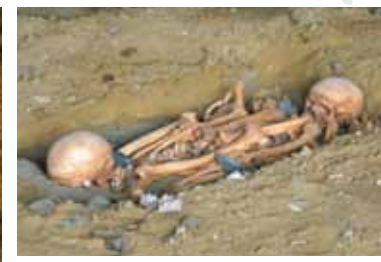
Reconstitution d'une sépulture de l'âge du bronze découverte en 1912

De cet extraordinaire labeur reste aujourd'hui un site de référence mondiale en matière d'architecture troglodytique tant par ses dimensions que par son nombre d'habitats et la variété des aménagements laissés sur les parois.