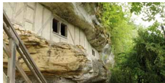
Habitat médiéval reconstitué

Silex taillés, os gravés, instruments de musique, armes et outils préhistoriques ainsi que des sépultures de nos lointains ancêtres. Ces collections témoignent de la présence humaine à la Roque St Christophe depuis au moins 55 000 ans jusqu'à l'aube des temps modernes.