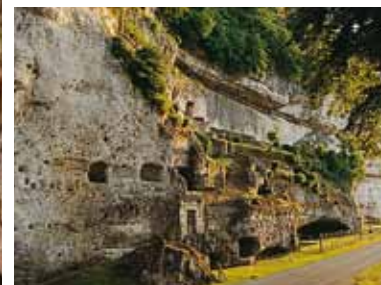
Gisement préhistorique au pied de la falaise